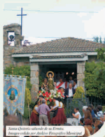
Santa Quiteria saliendo de su Ermita.

Los alpedreteños celebramos nuestras fiestas en honor a Santa Quiteria el 22 de mayo. La víspera, la imagen de la Santa es subida por las mujeres de su Hermandad hasta la Iglesia parroquial. Son los hombres quienes la llevarán en procesión en su día grande, bajándola las mujeres de nuevo a la Ermita, en una romería que congrega a innumerables asistentes, a pesar de la lluvia que la Santa suele traer, pero que nunca la moja a ella, pues nunca cae mientras su imagen recorre las calles. Durante el camino de bajada a la Ermita, Santa Quiteria lleva en sus manos unas medallas bendecidas, que se reparten entre los niños que ese año han sido bautizados, para protegerles y cuidarles.