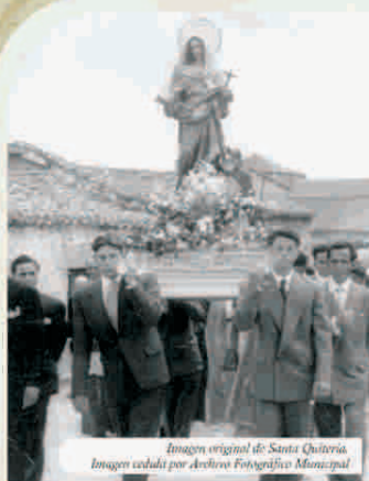
Imagen original de Santa Quiteria.

En su interior, destaca una imagen restaurada de la mártir, ya que la imagen original, que antaño se encontraba en la antigua Ermita, fue quemada durante la Guerra Civil, junto con otras imágenes de la Parroquia. En la imagen original, el perro que acompaña a la Santa estaba a su izquierda, mientras que ahora está a su derecha. Este perro lleva un peine en la boca, originalidad de Alpedrete surgida a raíz de una falsa interpretación de su patronazgo sobre la rabia. La imagen de la Santa porta en una mano la palma, signo del martirio, y un crucifijo en la otra.