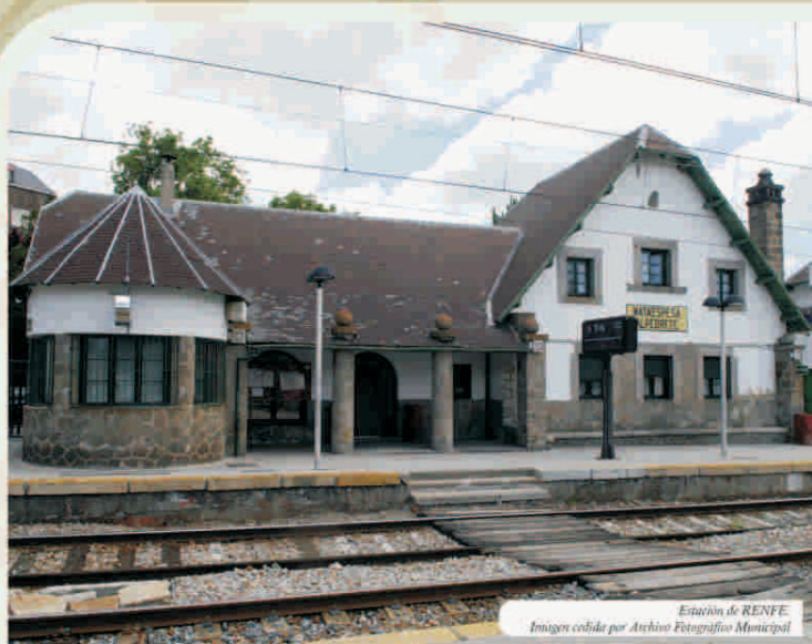
Estación de RENFE.

Esta Estación está enclavada en la Urbanización Los Berrocales, que era antiguamente una gran finca a la que venían a cazar importantes personajes de la nobleza, como el Rey Alfonso XIII. Sin embargo, la Estación debe su nombre a otra gran finca existente en nuestro término, la de Mataespesa, pues en ella se encontraba el antiguo apeadero, un paso a nivel con guardabarrera. Nuestra Estación, sus paredes de piedra, los techos de madera y tejados de pizarra, fueron salvados de su cierre y posterior destrucción gracias al apoyo ciudadano.