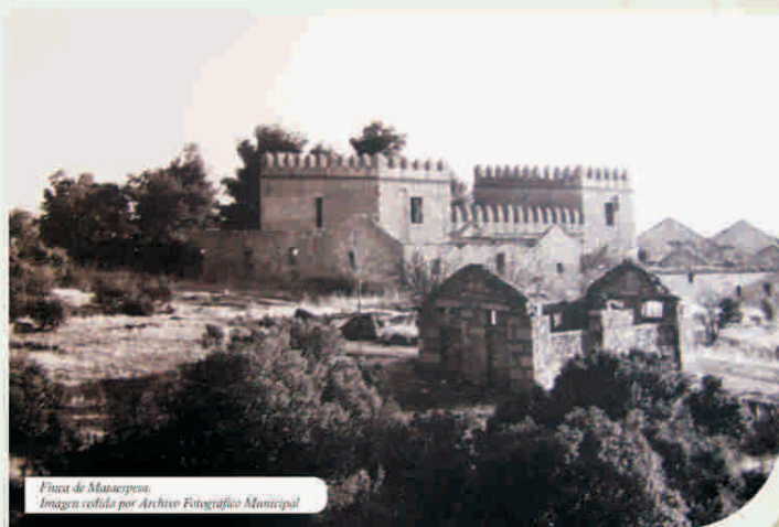
Finca de Mataespesa.

La Estación de Tren de Alpedrete fue construida tras la Guerra Civil, siguiendo el estilo de los antiguos apeaderos, aunque se utilizó piedra en vez de ladrillo visto. Antiguamente, en su interior se encontraban, además de la taquilla, un almacén de útiles de mantenimiento y la vivienda del Factor o Jefe de la Estación. Su cantina, con una gran terraza todavía en uso, daba mucha vida a esta zona, a pesar de estar un poco apartada del centro urbano. Era un lugar muy concurrido, sobre todo en la época estival, cuando los veraneantes llegaban al pueblo, atraídos por las posibilidades de ocio que ofrece nuestro entorno y las propiedades curativas del aire de la sierra.